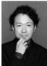
構成・演出 白井 晃

作曲家・ピアニスト。ジュリアード音楽院留学中にジョン・ケージと知り合い不確定性の音楽を展開。これまでに文化功労者等受章。日本芸術院賞等、及び恩賜賞等受賞多数。神奈川県芸術文化財団芸術総監督。