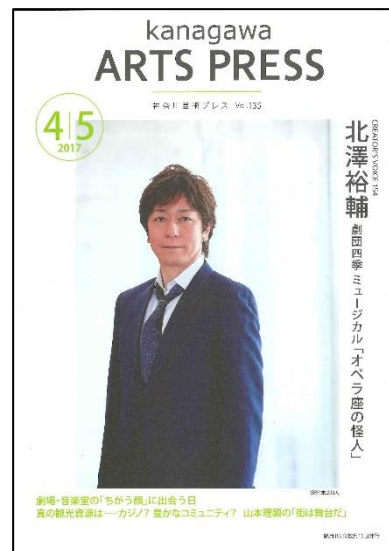
「神奈川芸術 PRESS」2017年4・5月号