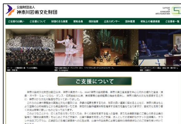
財団ホームページ「ご支援について」

現会員に継続いただくとともに、新規の会員獲得のため、法人、個人への働きかけを積極的に行う。また、来館者、一般の方々の賛助会員制度への理解を深めるため、案内リーフレットの配布やウェブサイトの充実などの方策を実施する。