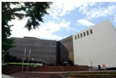
神奈川県民ホール

平成 29 年度から平成 30 年度にかけて予定されている県民ホールと音楽堂の改修工事に関して、来館者・利用者等と直に接する現場の指定管理者として、県に適時、適切に情報提供をしていくほか、改修工事に伴う休館に備えた事業計画の立案・実施や運営体制等の整備を進めていく。