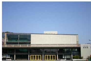
神奈川県立音楽堂