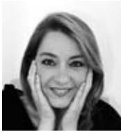
ルチア・ナボリ (アルト)