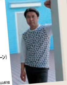
小曾根真

3月20日(日・祝) 神奈川県立音楽堂 全席指定 一般5,500円 学生(24歳以下)4,500円 出演:小曾根真(ピアノ) Special guest 近藤和彦(アルト・サクソフォーン)