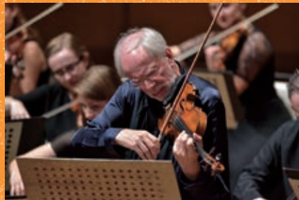
ギドン・クレメル&クレメラータ・バルティカ

室内楽は初めてだった。 口から息を出したり、 弦をつまんで音を出したり、 とても面白かった。音が多くて驚いた。 また来てみたい。(30代女性)