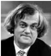
シグスヴァルト・クイケン (音楽監督&ヴァイオリン)