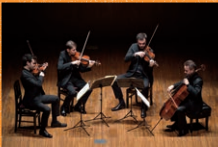
モディリアーニ弦楽四重奏団

もう鳥肌が立つくらい素晴らしかった。クレメルという人、その人が音楽なのだと感じずにはいられない。 バルティカのメンバーの人たちがクレメルに向ける眼差しが、 優しく厳しくうっとりとしていて、一途で、本当のアンサンブルを見た気がした。(50代男性)