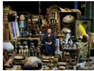
村上隆とスーパーフラット・コレクション

観覧料 一般1,500円、大学・高校生900円 中学生400円、小学生以下無料、65歳以上1,400円 開館時間: 10:00~18:00(入館は17:30まで) 休館: 木曜日 ※2月11日(木・祝)は開館