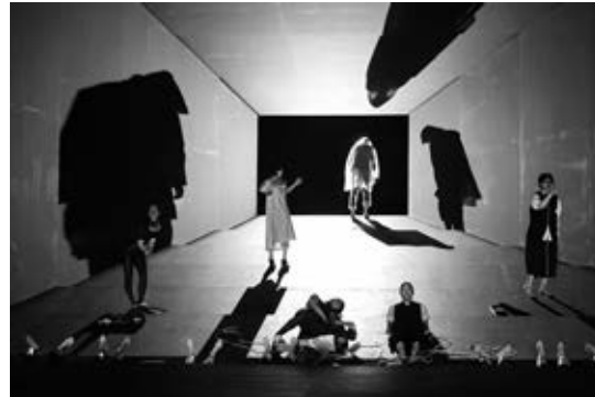
『光のない。』(2014)

KAATとの共同制作を毎年継続している、地点。2013年に京都に開設したアトリエ「アンダースロー」を拠点に国内外で活動を展開し、チェーホフをはじめ国内外のテキストを用いながら、代表の三浦基による言語と身体の固定観念を解体するような演出によって、先鋭的な現代演劇を生み出している。