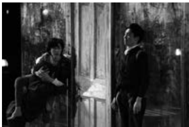
『三人姉妹』(2015)

そして今回、地点が選んだのは、イエリネクが1998年に発表した長大な戯曲『スポーツ劇』。大衆が熱狂するスポーツの今のあり様を戦争にも見立てて批判するイエリネクだが、エレクトラ、アキレウス、ヘクトールといったギリシャ悲劇の登場人物たちを舞台上に登場させ、膨大なテキストのコラージュあるいは断片的なモノローグが多層的に織りなす戯曲は、単なる社会批判に終わらない。音楽監督にはふたたび三輪眞弘を迎え、現代演劇の最前線において、政治とメディアに翻弄される21世紀のスポーツはいかに料理されるだろうか。