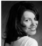
ミンナ・ニーベリ (ソプラノ)