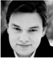
シュテファン・シェルベ (テノールI&エヴァンゲリスト)