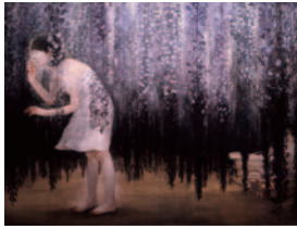
世界中の子と友達になれる 2002年(平成14) 絹本着色、裏箔、雲肌麻紙 181.8×227.8cm 個人蔵(横浜美術館寄託)