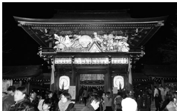
八方除の守護神として信仰されている寒川神社の初詣風景